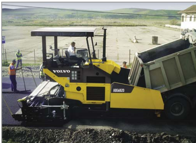
1. kép Volvo aszfaltfiniser

Az útépítőgépek magas műszaki színvonalal készülnek Volvo márkanév alatt. Az útépítőgépek közül az aszfaltfiniserek és az aszfalttömörítő hengerek felépítésébe, műszaki újdonságaiba szeretnék betekintést adni.